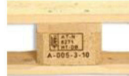
Pallet height (blocks)