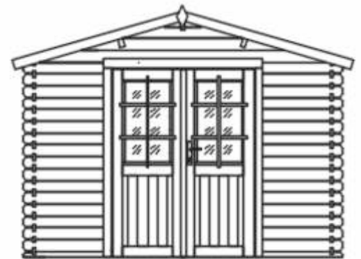
Alle Modelle sind ohne Dachrinne.